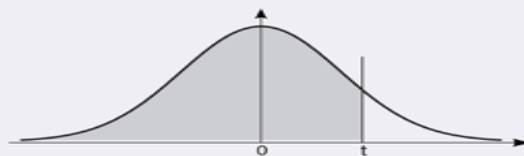
Table donnant P(Z < t) pour une variable aléatoire suivant N(0,1)